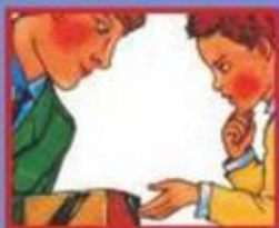
В ТРАНСПОРТЕ- ВОДИТЕЛЮ