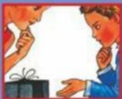
В МАГАЗИНЕ- ПРОДАВЦУ