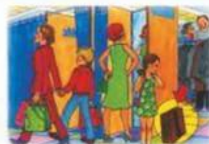
В ОБЩЕСТВЕННЫХ МЕСТАХ