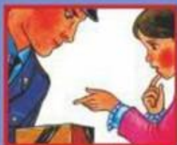
НА УЛИЦЕ ИЛИ В МЕТРО- ПОЛИЦЕЙСКОМУ