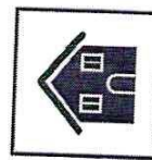
Оставайтесь дома в период эпидемии: соблюдайте правила безопасности