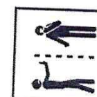
Ограничьте контакты с заболевшими людьми