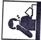
Покашливайте, кашляйте в локтевой сгиб: при чихании, кашле, насморке

Соблюдение следующих гигиенических правил позволит существенно снизить риск заражения или дальнейшего распространения гриппа, коронавирусной и других ОРВИ.